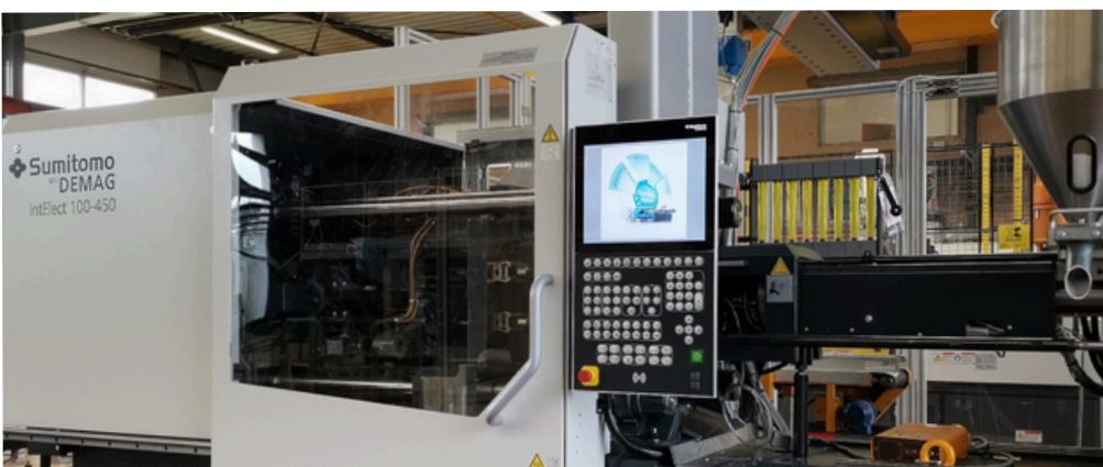
GOUJONS GRANDE DIMENSION