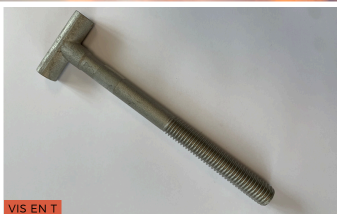
VIS EN T